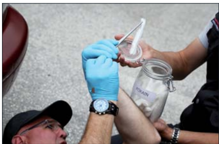
Zde je možné vidět, jak vypadá vzorek 10 gramů kokainu.

z Holanska a Egon Muggi z Rakouska. Výkony některých rozhodčích bohužel neodpovídaly evropskému standardu.